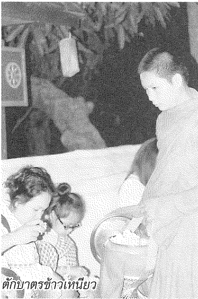
เด็กबाटชาวเหนียว