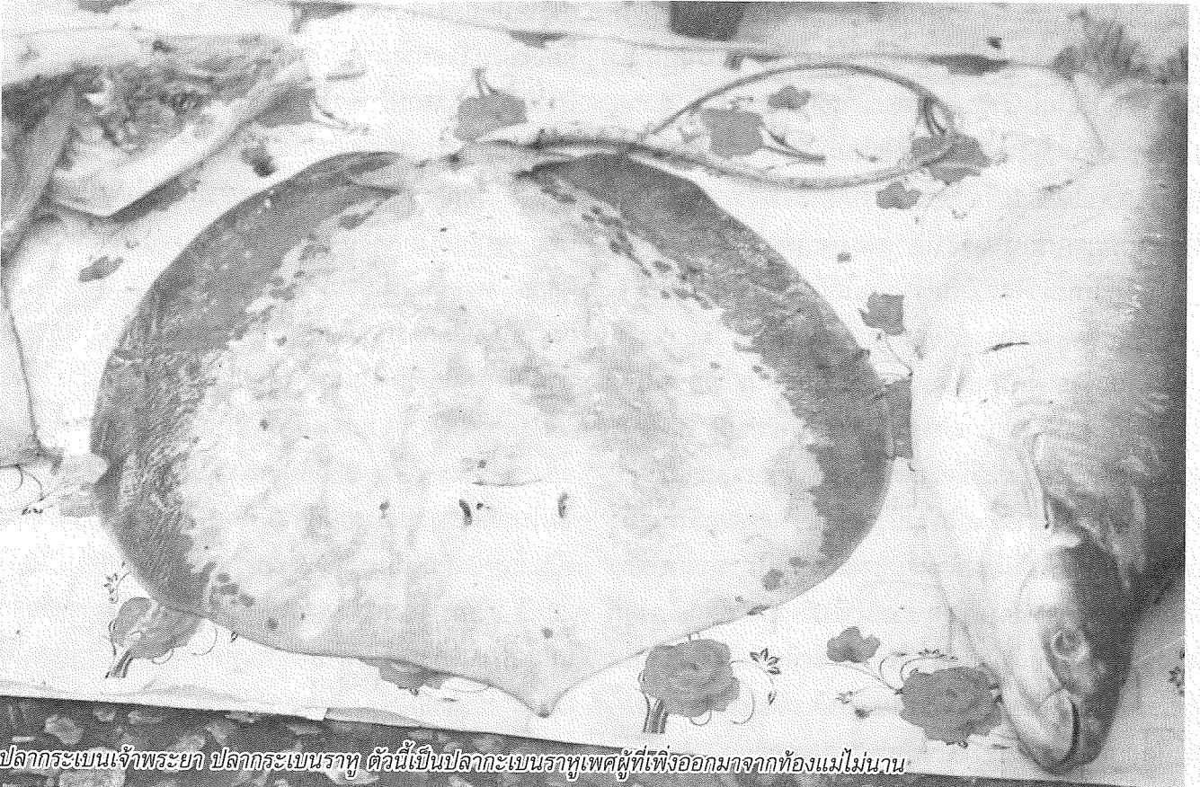
ปลากะเบนเจ้าพระยา ปลากะเบนราหู ตัวนี้เป็นปลากะเบนราหูเพศผู้ที่เพิ่งออกมาจากท้องแม่ไม่นาน