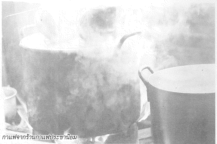
กาแพจากร้านกาแฟประชานิยม

ขึ้นเป็นลำดับที่ไม่ต้องแข่งกับกระแสน้ำที่เชี่ยวกราก ปลาที่มีขายในตลาดขึ้นอยู่กับการจับได้ของชาวประมงที่มีความหลากหลายมากขึ้นเรื่อยๆ ไปแต่ละวัน ปลาที่เห็นเป็นประจำ เช่น ปลากดคัง ปลาเบียว ปลาเนื้ออ่อน ปลาแดง ปลาแดงไห ปลากระสูบขีด ปลากระสูบจุด ปลาน้ำฝาย ปลาตะกอก ปลาทราย ปลาตองลาย ปลาเก๋า ปลาแค้ ปลากระทิง รวมไปถึงปลาขนาดเล็กจากลำธาร เช่น ปลาเลียหิน ปลามอน ปลาซิ้ง และปลาหมู เป็นต้น สภาพของแหล่งน้ำที่หลวงพระบางที่มาจากแม่น้ำหลายสายขนาดใหญ่ รวมถึงแหล่งน้ำบนภูเขาอีกมาก เป็นเมืองที่น่าหลงใหลในเรื่องของธรรมชาติ นอกจากนี้ยังมีปลากระเบนราหู หรือปลากระเบนเจ้าพระยาซึ่งเป็นปลากระเบนน้ำจืดที่มีขนาดใหญ่ได้ถึง 300 กิโลกรัม