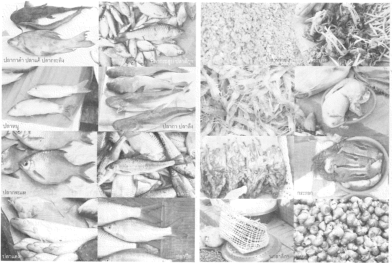
ปลากาดำ ปลาแค้ ปลากะตัง